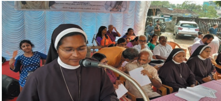
SOS ഐക്യദാർഢ്യസമ്മേളനം - കോട്ടയം

കേൾക്കുകയും ചെയ്യുന്നുണ്ടായിരുന്നു. മദ്യങ്ങൾ കലർത്തിക്കഴിച്ചാൽ ലഹരിക്കും. പുരോഹിത ഭക്തിലഹരിക്കുപുറമേ മദ്യലഹരിയും മുത്തരങ്ങൾ അലമ്പുണ്ടാക്കാൻ ശ്രമിച്ചു. അവസാനം ശ്രോതാക്കൾക്ക് അവസരം തരുമെന്ന് അയാളോടു പറഞ്ഞു. അവസാനം നോക്കിയപ്പോൾ അയാളുടെ പൊടിപോലും കാണാനില്ല. അങ്ങനെ മുതലക്കോടം ഇടവകയിൽ നവീകരണത്തിന്റെ വിത്തുവിതയ്ക്കപ്പെട്ടു. കേരളത്തിലെ എല്ലാ ഇടവകകളിലും ഇത്തരം യോഗങ്ങൾ നടക്കണം. സഭയെ യേശുവിന്റെ കാര്യം പാതയിൽ എത്തിക്കുക എന്നതാണ് ഒരു വിശ്വാസിക്ക് ചെയ്യാവുന്ന ഏറ്റവും നല്ല വലിയ കാര്യമെന്ന് എല്ലാവരും ഓർത്താൽ മതി. അതു ചെയ്യാതെ യേശുവേണുവിളിച്ച് നെഞ്ചത്തടിച്ചിട്ട് ഒരു കാര്യവുമില്ല.