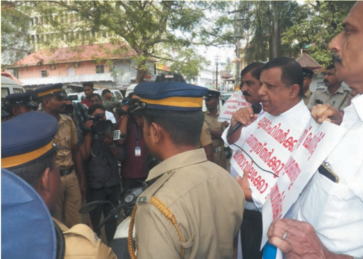
ഇടയലേഖനം കത്തിക്കൽ പരിപാടി-എറണാകുളം

ഴിയിലും താമര വിടരും. ക്രിസ്ത്യൻ ചെളിക്കുഴിയിലും ഇസ്ലാമിക ചെളിക്കുഴിയിലും ഹൈന്ദവചെളിക്കുഴിയിലും. അതുകൊണ്ടുവർ തീവ്രവാദി എന്ന നിരൂപദ്രവകരമായ വാക്കിൽ ചോരക്കൊതി കുത്തി നിറച്ചു.