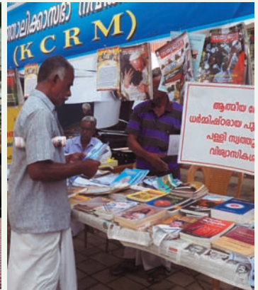
KCRM ബുക്ക് സ്റ്റാൾ