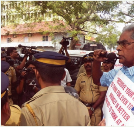
ഇടയലേഖനത്തിനെതിരെ എറണാകുളത്ത് പ്രതിഷേധം