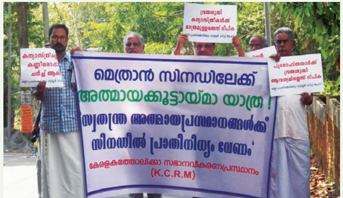
സീറോ-മലബാർ സിനഡിലേക്ക് പ്രതിഷേധമാർച്ച്