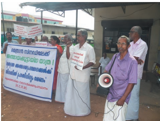
സീറോ-മലബാർ സിനഡ് ആസ്ഥാനത്തേക്ക് കെ.സി.ആർ.എം. മാർച്ച്

KCRM -ന്റെ കൂടിവരുന്ന പ്രവർത്തനങ്ങൾക്ക് ഭാരിച്ച സാമ്പത്തികച്ചെലവ് ഉണ്ടാകുന്നുണ്ട് എന്നൊരു വസ്തുതയാണ്. എന്നാൽ അതിനുള്ള പണമൊക്കെയും, അന്നയപ്പംപോലെ , ഇന്നുവരെ എങ്ങനെയൊക്കെയോ ലഭിച്ചുകൊണ്ടാണിരുന്നത് എന്നും പറയട്ടെ. കഴിഞ്ഞ 6 മാസത്തിനുള്ളിൽ 1 ലക്ഷത്തോളം രൂപ KCRM-ന്റെ അഭ്യുദയകാംക്ഷികൾ എത്തിച്ചു നൽകുകയുണ്ടായി എന്ന്