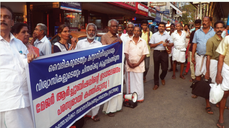
ഇടയലേഖനത്തിനെതിരെ പാലായിൽ പ്രതിഷേധം